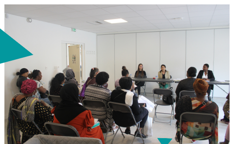
"Recrutement ARPAVIE à Villiers-le-Bel"