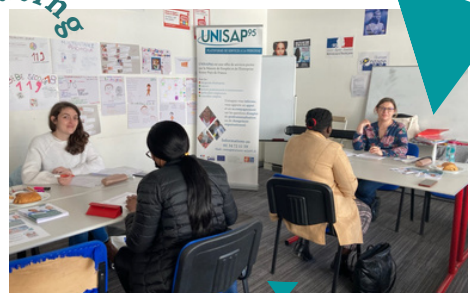
"Recrutement Ressources Formation à Sarcelles"