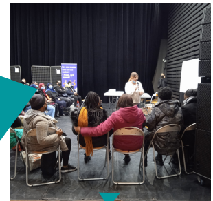
"Présentation des métiers à Sarcelles"